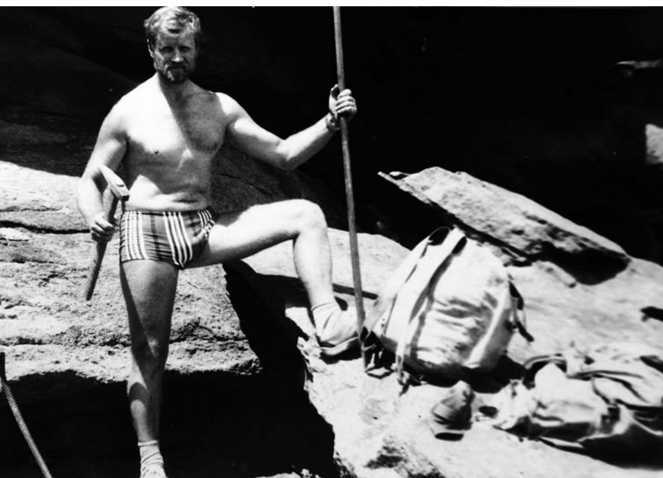
В геологической экспедиции.