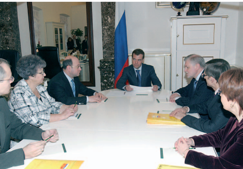
2008 г. Встреча Президента РФ Д. А. Медведева с С. М. Мироновым и лидерами партии «Справедливая Россия».