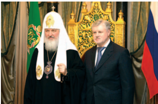
С. М. Миронов и Патриарх Кирилл.