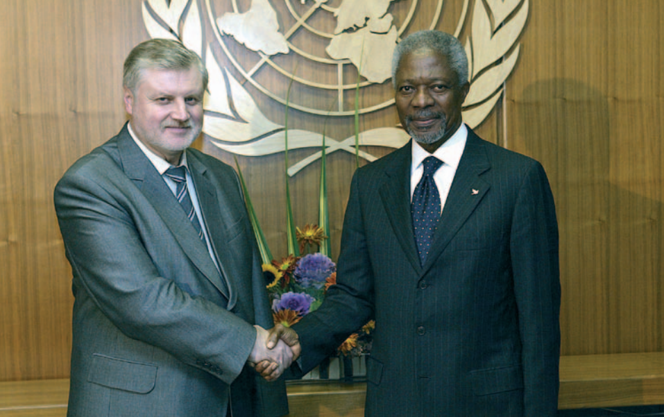
Нью-Йорк. Встреча С. М. Миронова с Генеральным секретарём ООН Кофе Ананом.