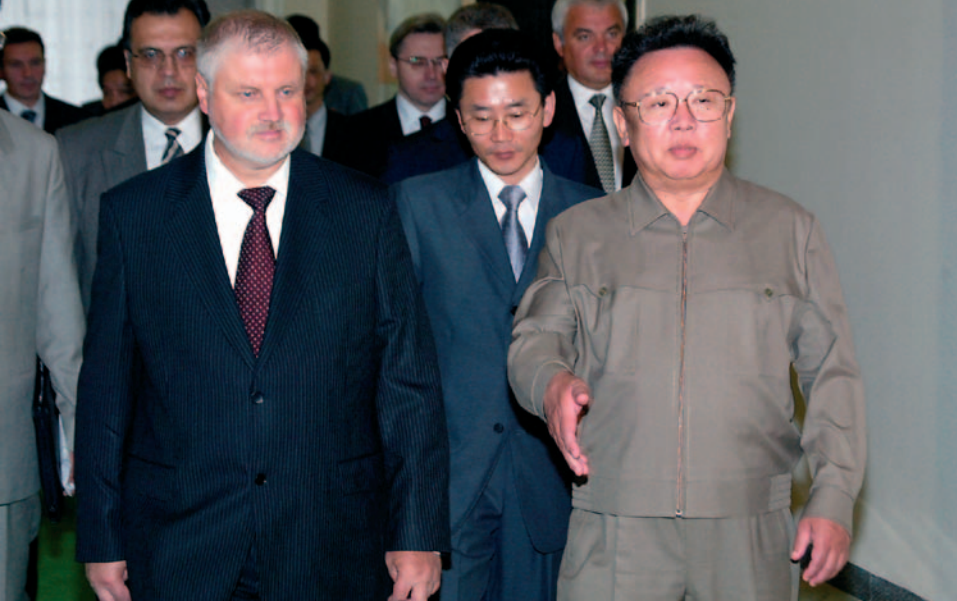
Пхеньян. С. М. Миронов и лидер Северной Кореи Ким Чин Ир.