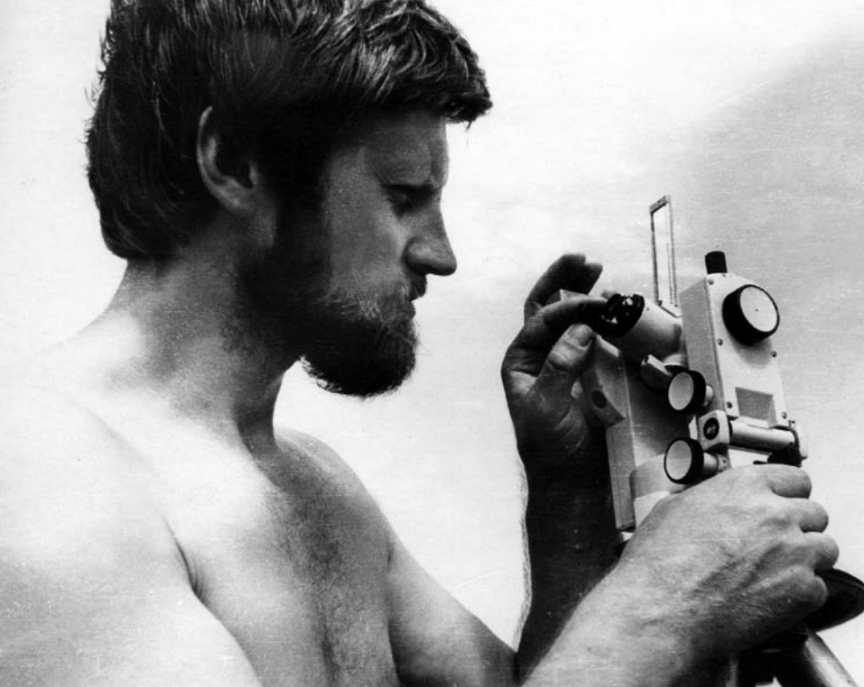
Подготовка геологического оборудования.