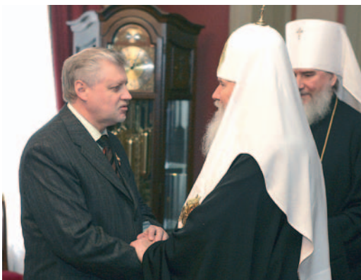
20 февраля 2008 г. Алексий Второй поздравляет С. М. Миронова с вручением ему ордена Сергия Радонежского I степени.