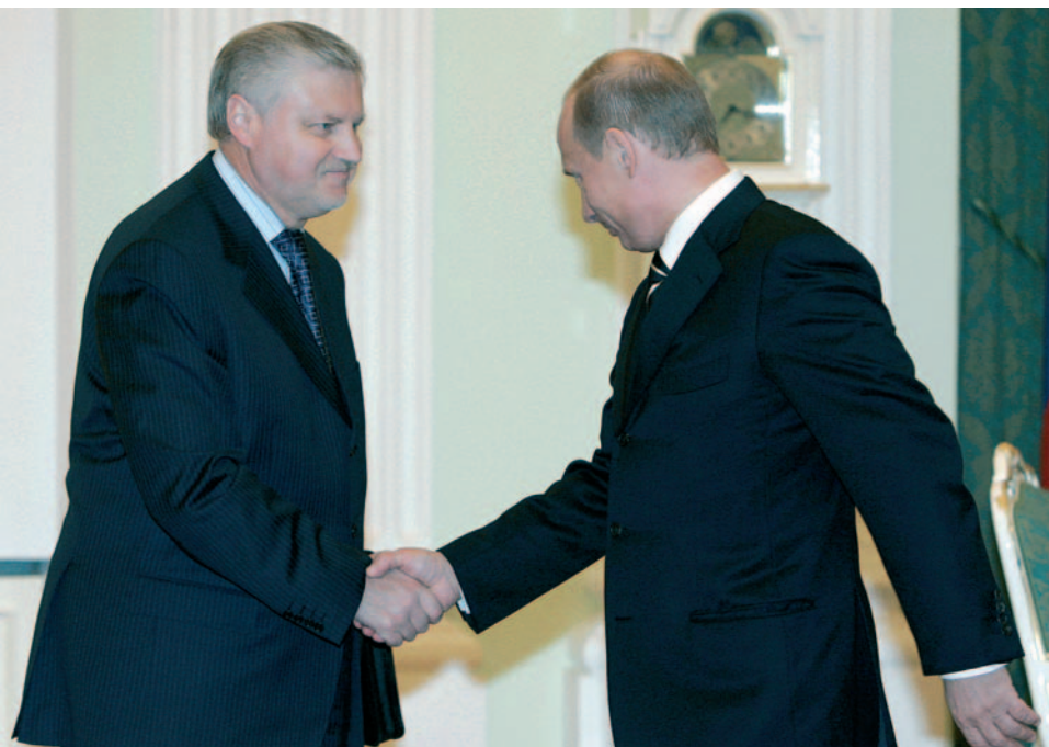
2005 г. Рабочая встреча С. М. Миронова с президентом РФ В. В. Путиным.