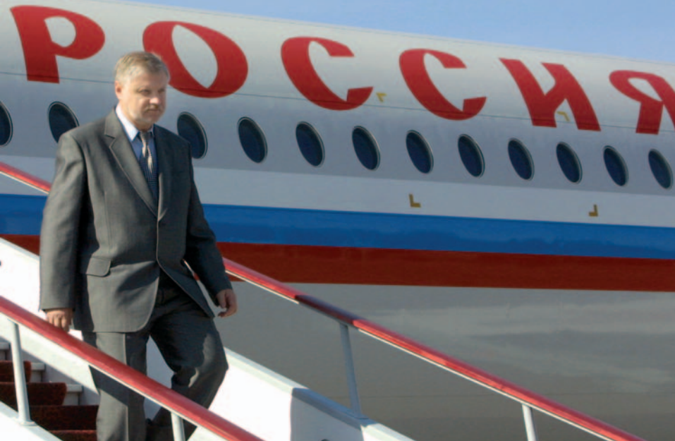
С. М. Миронов спускается с трапа из самолета.