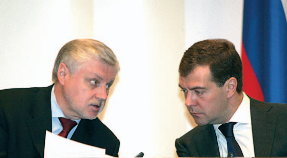
Совет Федерации. Д. А. Медведев и С. М. Миронов на заседании Совета законодателей.