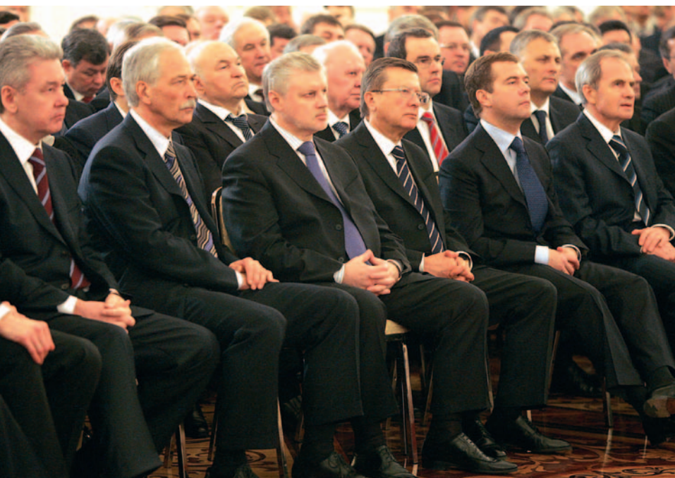
Восьмое января 2008 г. С. М. Миронов во время выступления президента РФ В. В. Путина в Кремле.