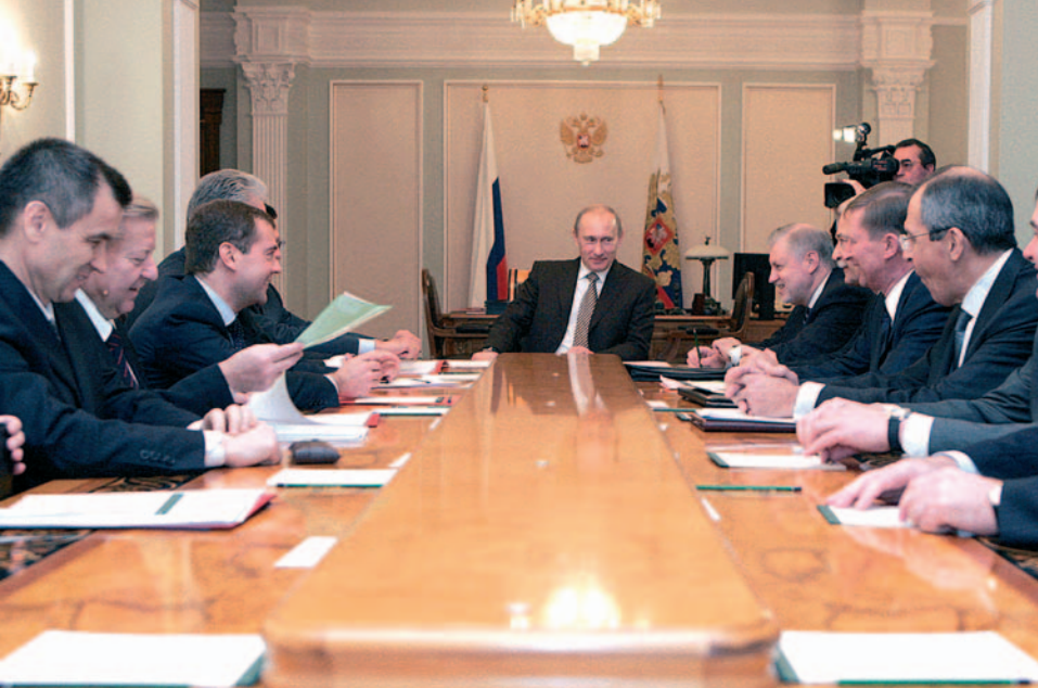
2007 г. С. М. Миронов на заседании Совета безопасности.