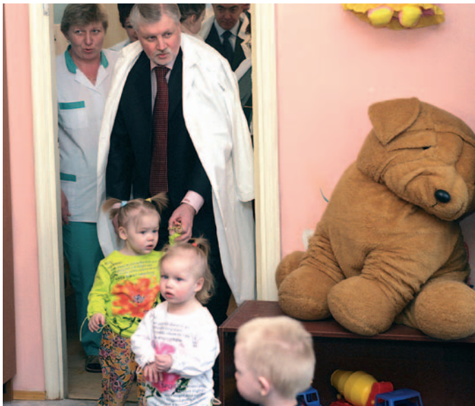
С. М. Миронов во время посещения детской комнаты женской исправительной колонии.