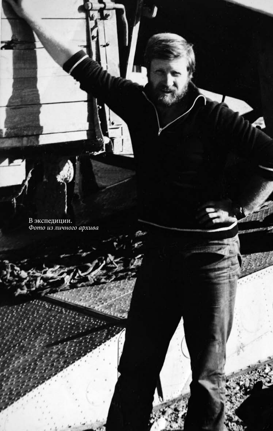
В экспедиции.