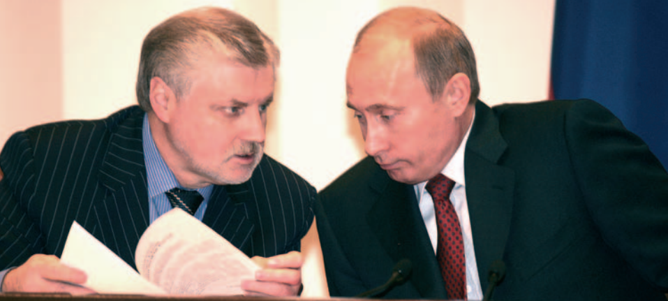
2005 г. Совет Федерации. Беседа С. М. Миронова с президентом РФ В. В. Путиным.