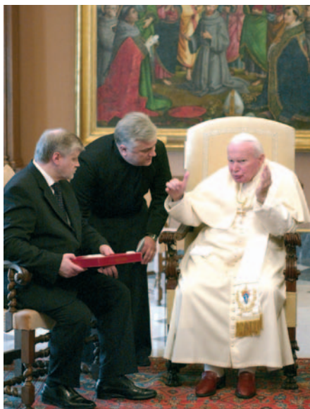
Встреча С. М. Миронова с Папой Римским Иоанном Паслом II. Ватикан. 2003 г.