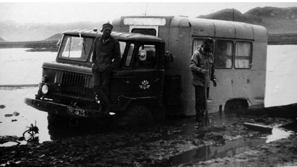
Преодоление водного препятствия.