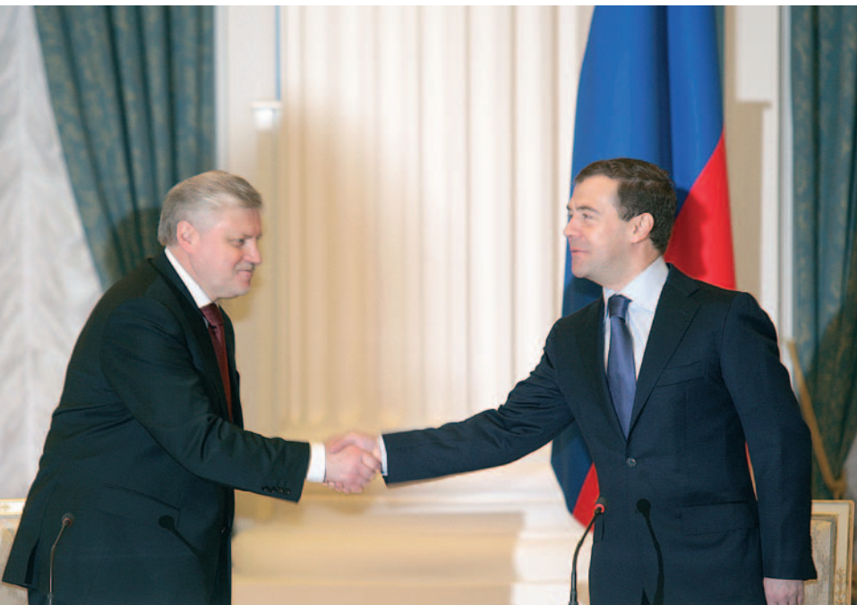
2008 г. Встреча президента РФ Д. А. Медведева с С. М. Мироновым.