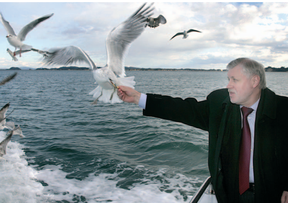
С. М. Миронов.