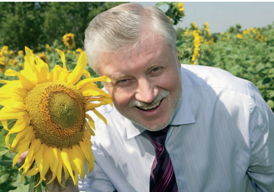
С. М. Миронов в Белгородской области.